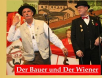
Der Bauer und Der Wiener